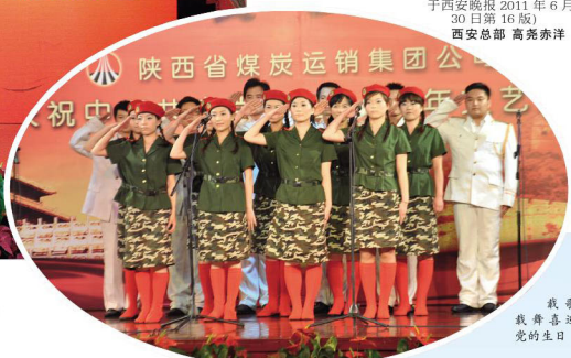
载歌载舞喜迎党的生日

陕煤运销集团公司6月29日下午举行庆祝中国共产党成立90周年暨创先争优表彰大会,对优秀共产党员、优秀党务工作者和先进党支部进行表彰。