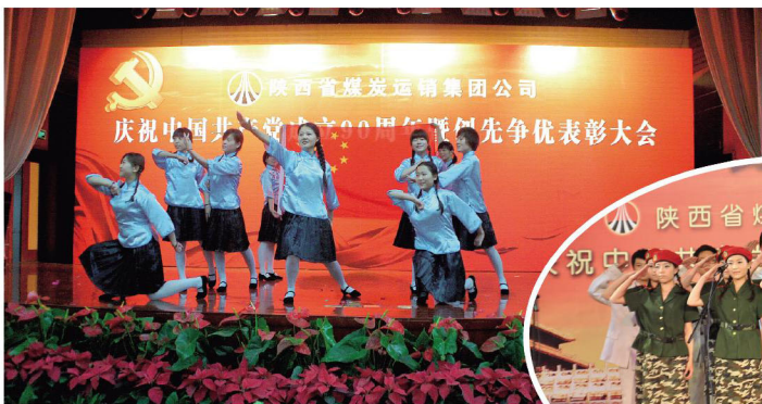
载歌载舞喜迎党的生日